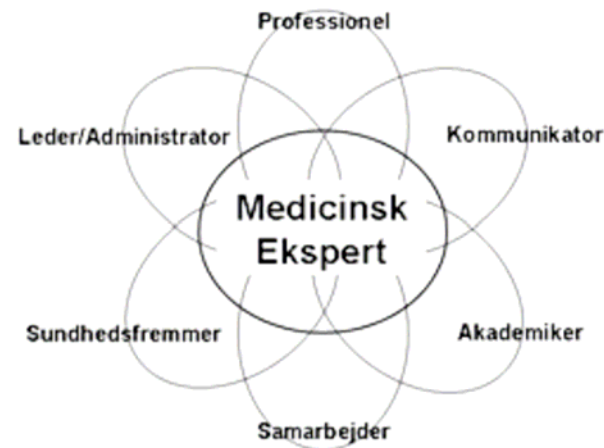
De syv speciallægeroller

Omfatter vor evaluering en bedømmelse af de 7 kompetencekrav?